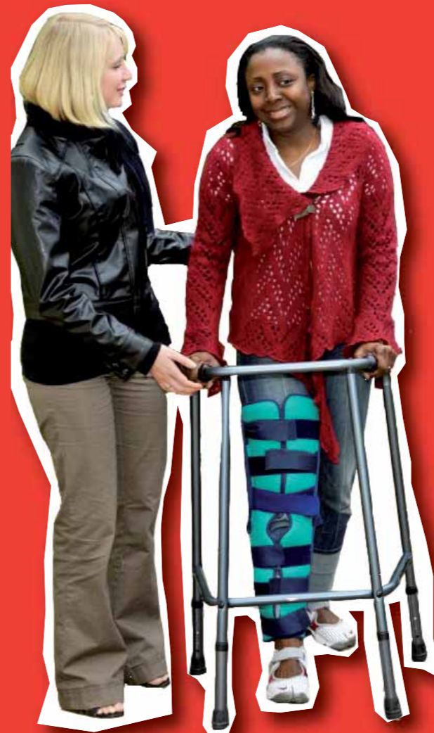
Prisme-Limousin - juillet 2009